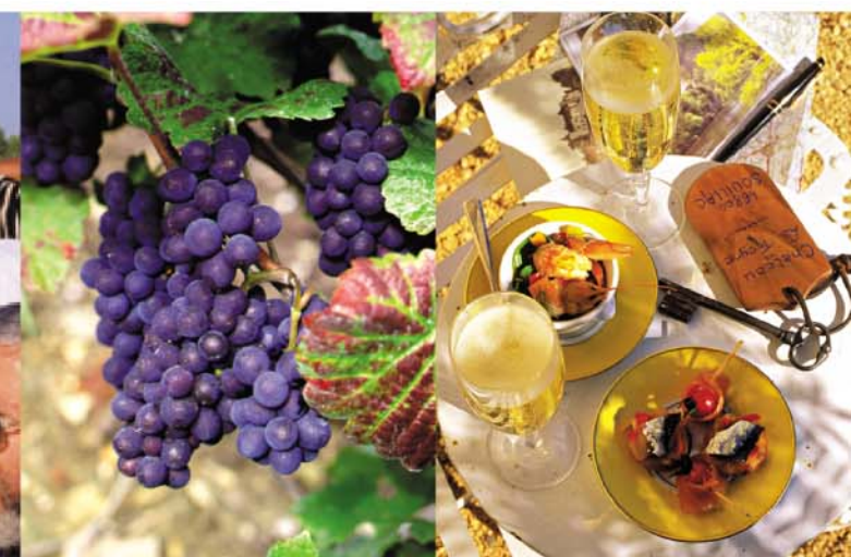
香檳亞丁省產的黑葡萄。