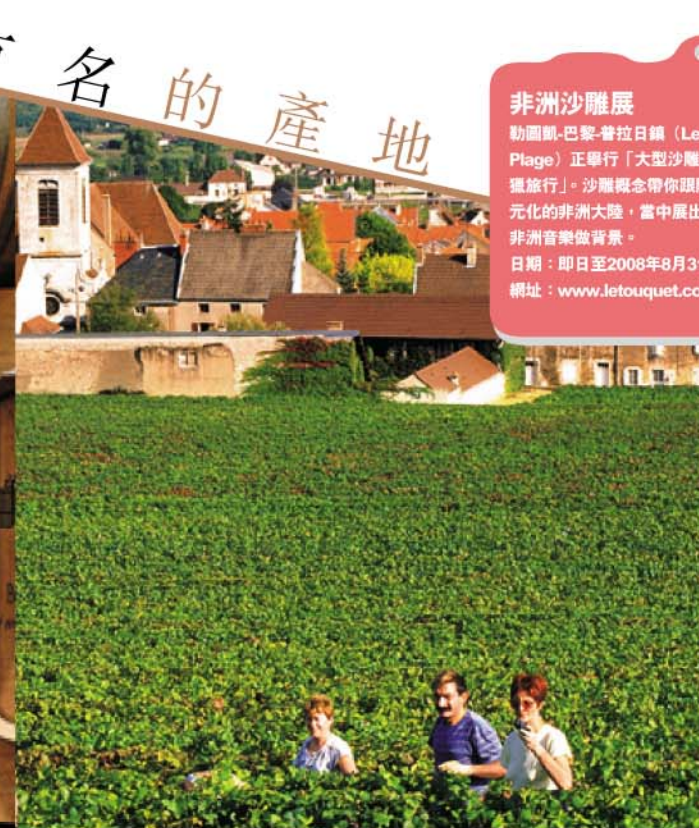
勃艮第省的葡萄收成時，是絕佳景象。