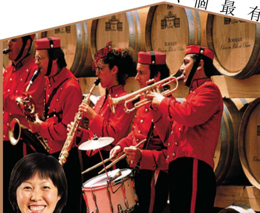
波爾多葡萄酒節中，有樂隊即場表演，氣氛高漲。