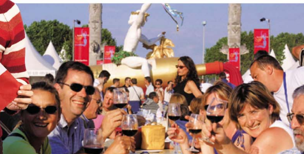
波爾多葡萄酒節中個個舉杯，連酒瓶裝置都有人騎住！